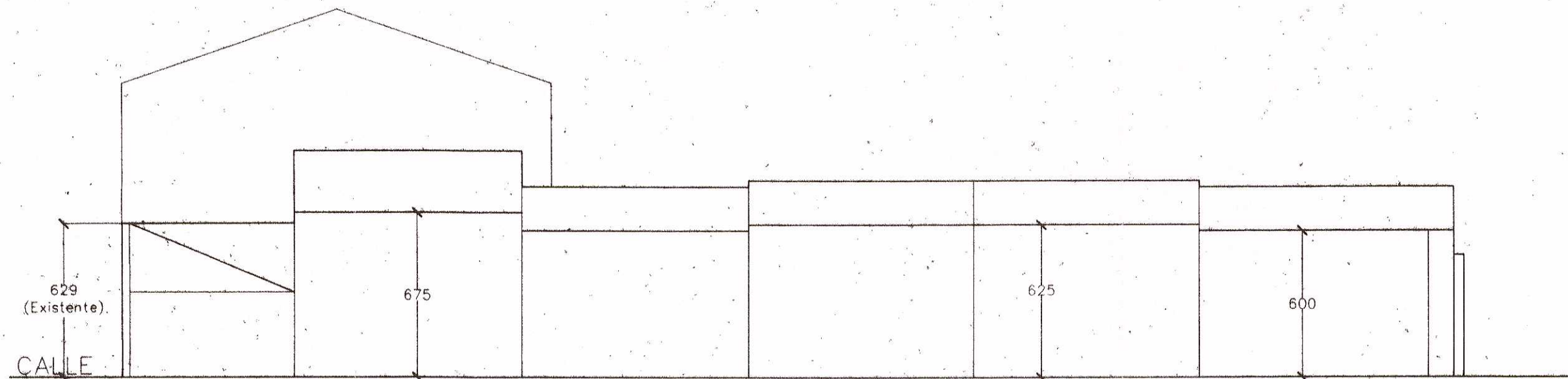
ALZADO A PATIO. ESCALA : 1/200.