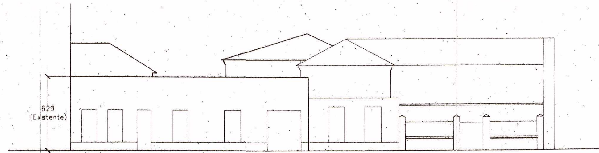
ALZADO A CALLE SANTIAGO. ESCALA : 1/200.